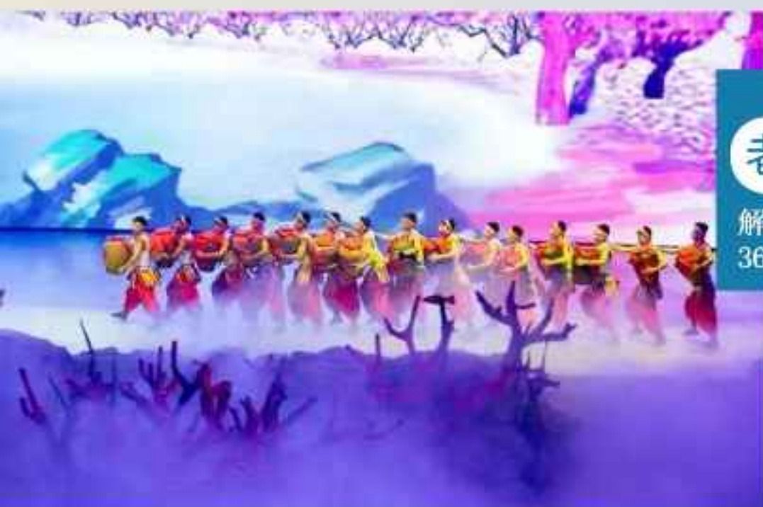
老院子闽南传奇秀