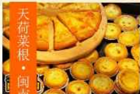
天荷菜根·闽南素食自助餐厅