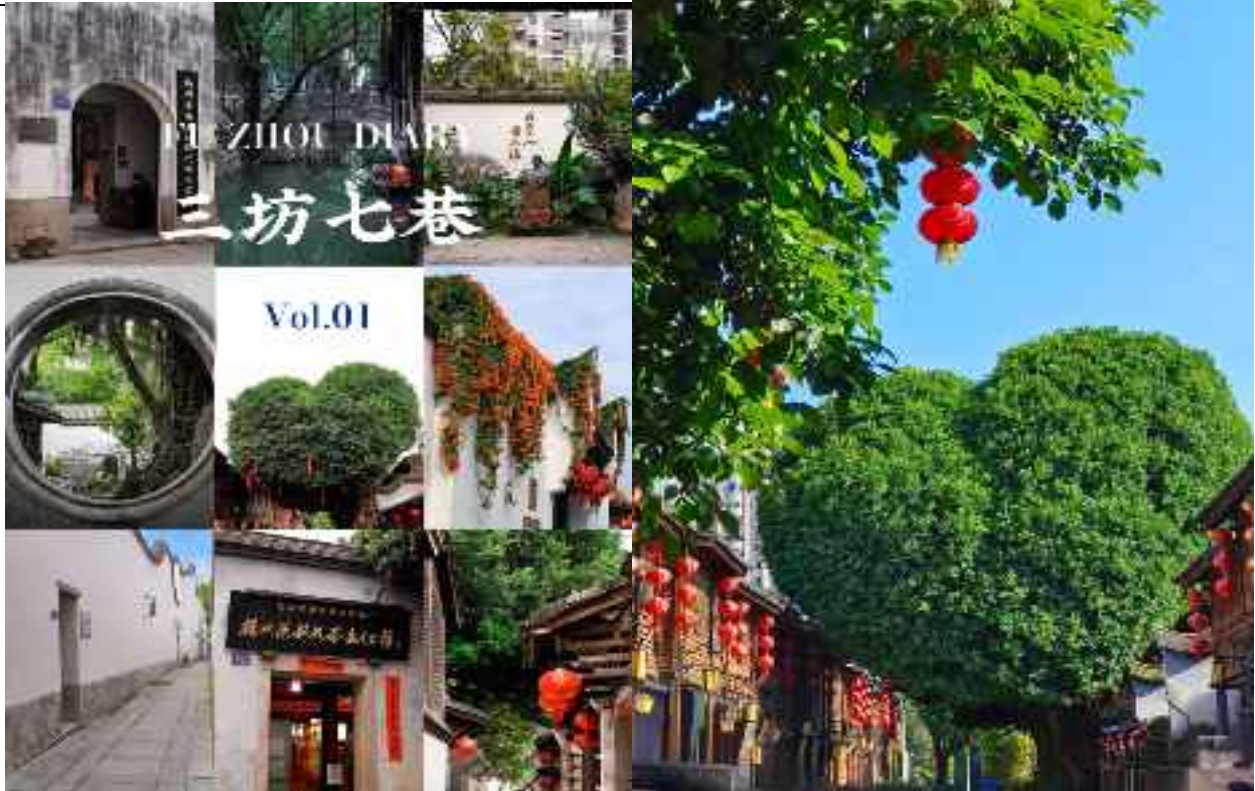
适合返回泉州酒店办理入住