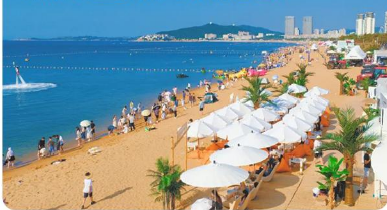
威海国际海水浴场