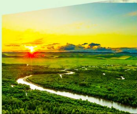
4A 额尔古纳湿地公园