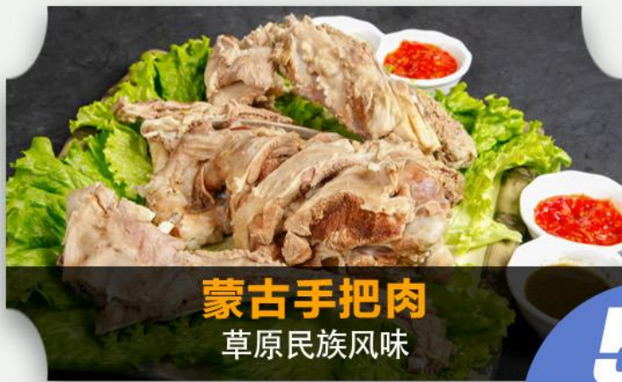
蒙古手把肉 草原民族风味