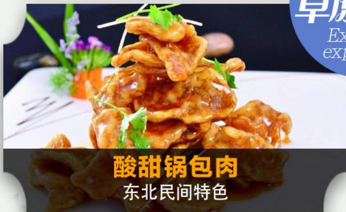
酸甜锅包肉 东北民间特色