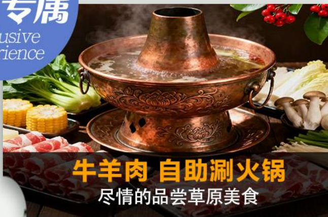
牛羊肉 自助涮火锅 尽情的品尝草原美食