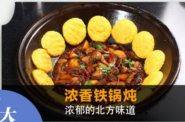
浓香铁锅炖 浓郁的北方味道