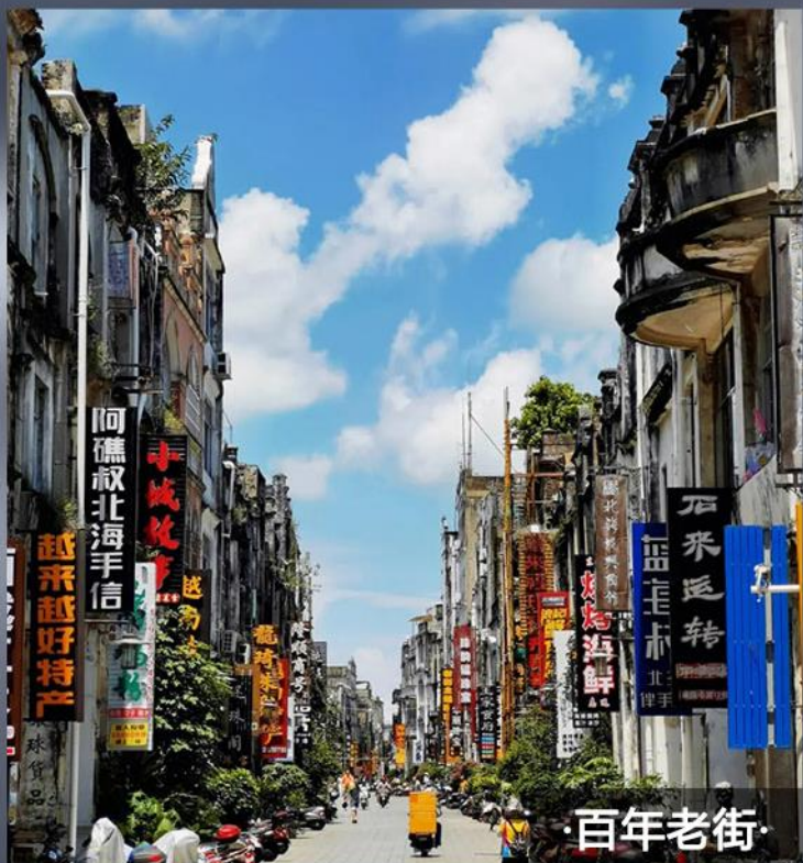
· 百年老街 ·