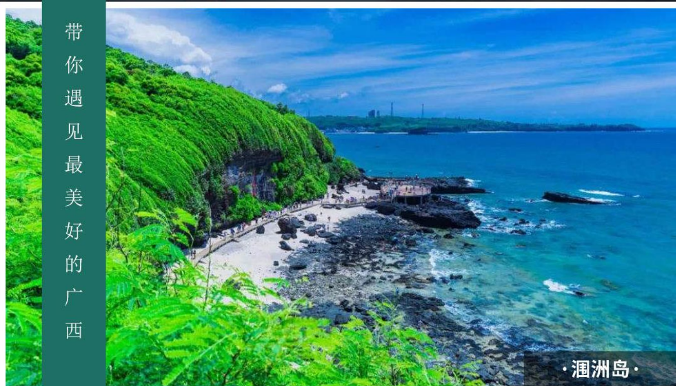
· 涠洲岛 ·