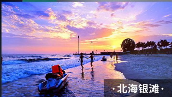
· 北海银滩 ·