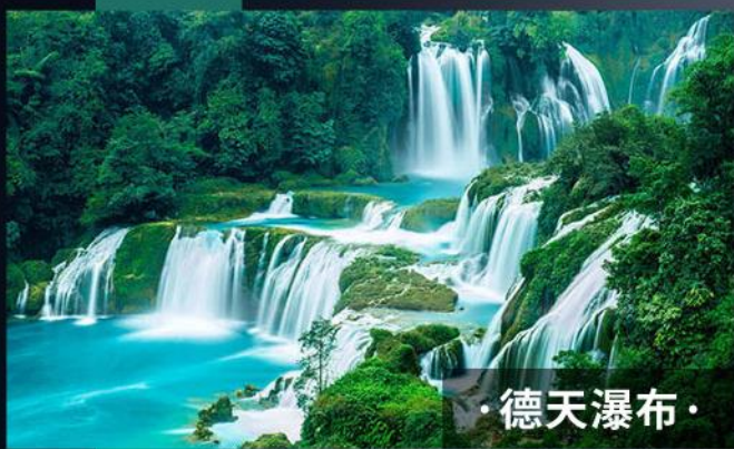
· 德天瀑布 ·