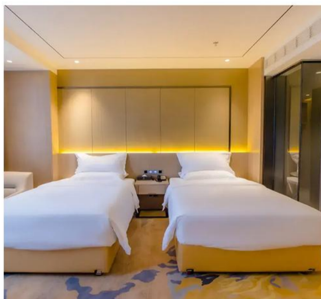
潮州豪逸酒店或同级