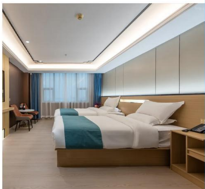
潮州悦枫酒店或同级