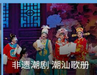
非遗潮剧 潮汕歌册