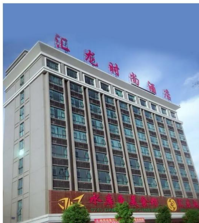
揭阳悦汇龙或同级