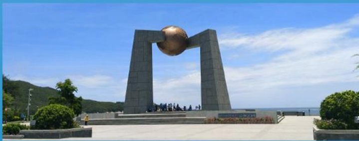
我国唯一一座建在海岛上的标志塔