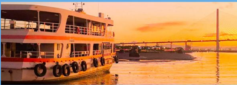
游船观中国唯美汕头内海湾