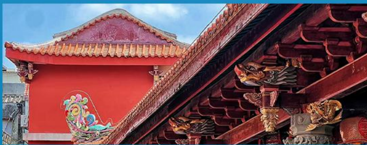
广东四大名寺之一，“古代建筑艺术明珠”