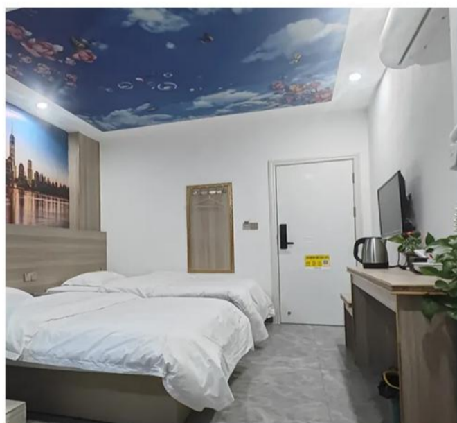
潮州壹时光酒店 (彩塘店) 或同级