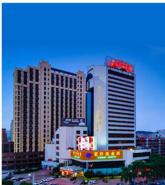
揭阳特美斯酒店或同级