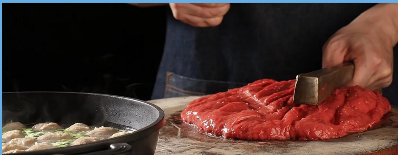
非物质文化遗产 围炉手捶牛肉丸 每人一碗