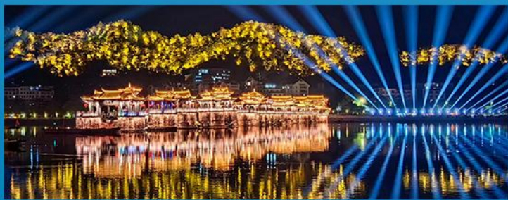
世界最早启闭式桥梁，现存四大古桥之一