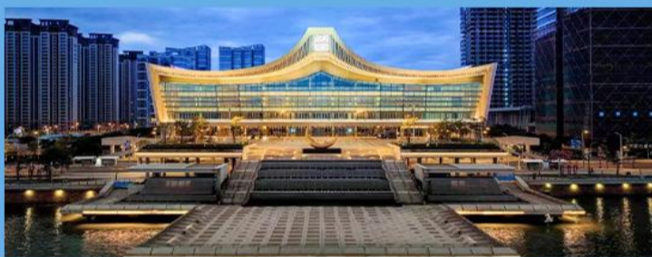
展示和弘扬潮汕历史文化、华侨文化及精神