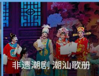
非遗潮剧 潮汕歌册