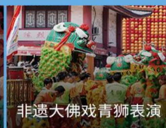
非遗大佛戏青狮表演