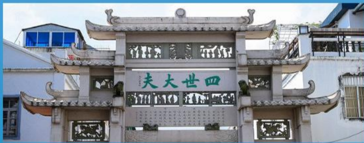
集非遗展示、传统工艺和特色小吃于一体