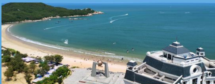
被誉为东方夏威夷，南澳岛上最美沙滩