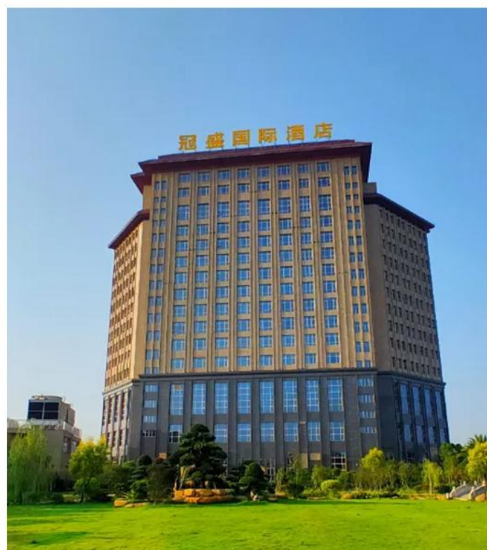
揭阳冠盛酒店或同级