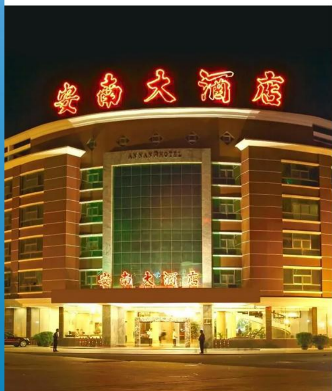
潮州安南酒店或同级