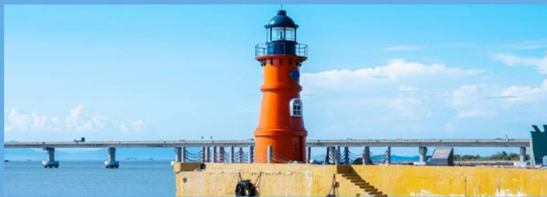
打卡中国最美的十大海岛之一南澳岛