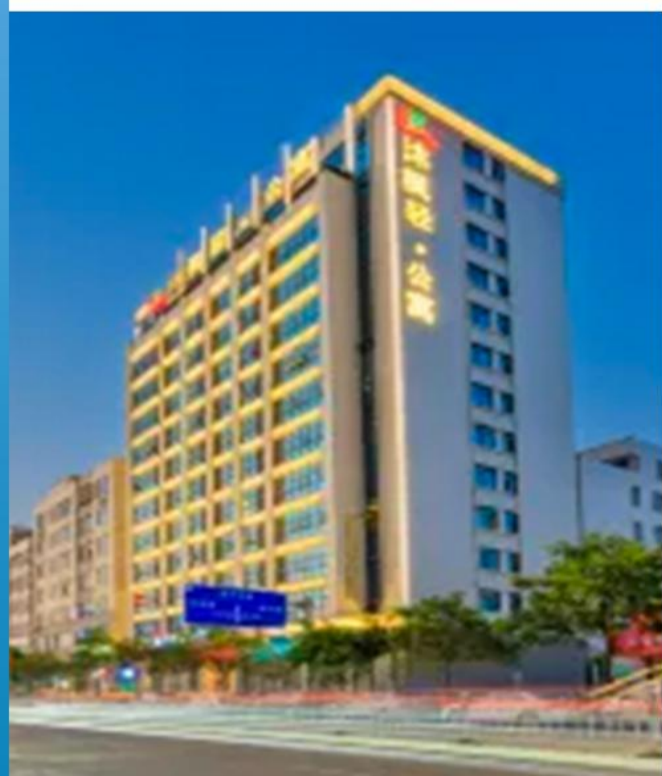
汕头澄海沐枫酒店或同级