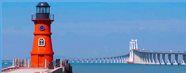
深度游览中国十大海岛之一