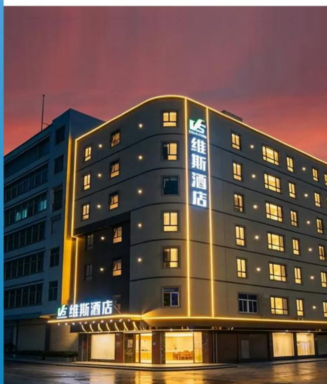
汕头澄海维斯酒店或同级