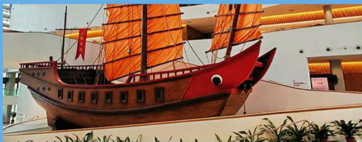
汇聚潮汕地区精美艺术品