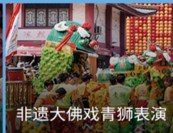
非遗大佛戏青狮表演