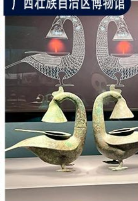
探秘壮乡博物馆 沉浸式触摸八桂千年文明