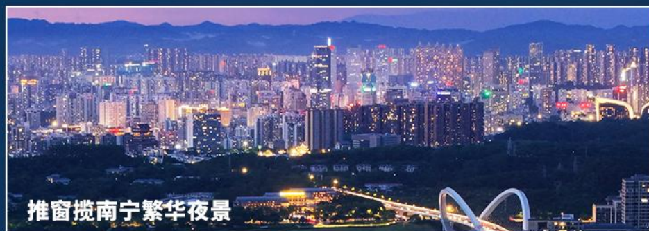
推窗揽南宁繁华夜景