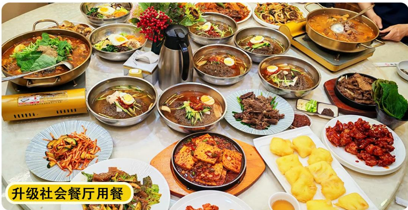
升级社会餐厅用餐