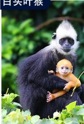
探寻“石山精灵” 生态保护区走进喀斯特自然王国