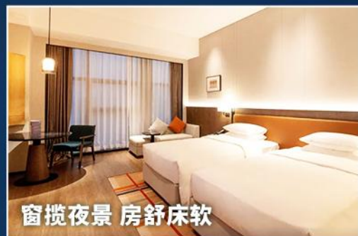
窗揽夜景 房舒床软