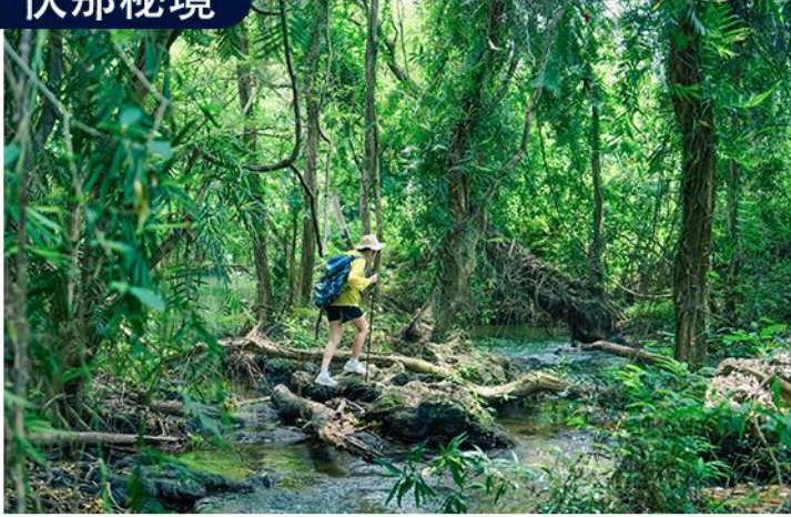
一片独家私藏的小众雨林，旅行者心向往之的秘境