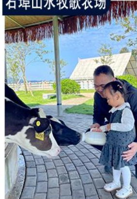
牧场研学，感受乳业农耕智慧 体验“一杯牛奶”的生产过程