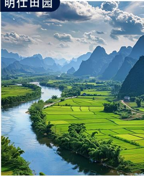
国家AAAA级旅游景区 现实版“隐世桃源”