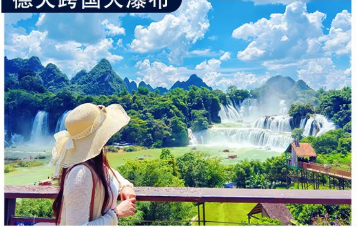
国家5A级景区，横跨中越两国，亚洲第一大跨国瀑布