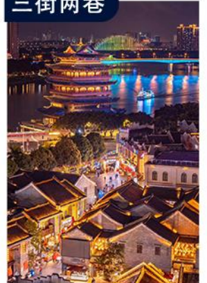
自由打卡南宁网红街 “吃、喝、玩、乐”的汇集地