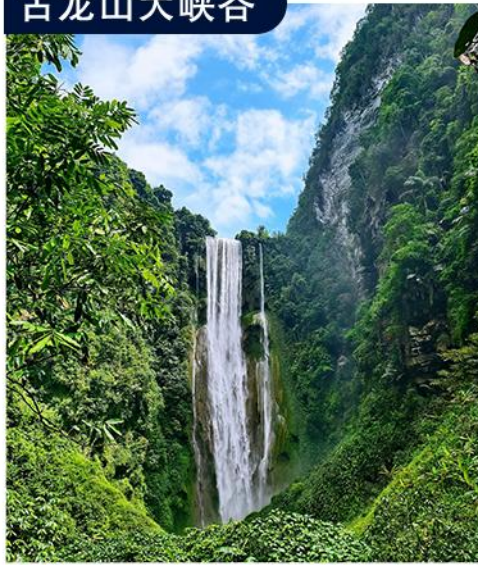
中国最大原生态洞穴峡谷 四峡三洞三暗河世界级奇观