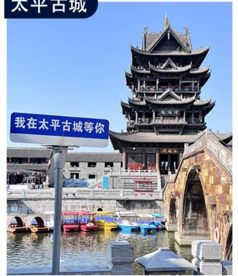
千年壮乡文化与现代文化融合 “广西版的大唐不夜城”