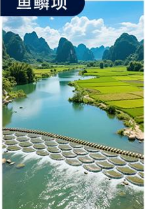
层层水流叠成鱼鳞碧波 清澈浅滩清凉治愈满眼美景