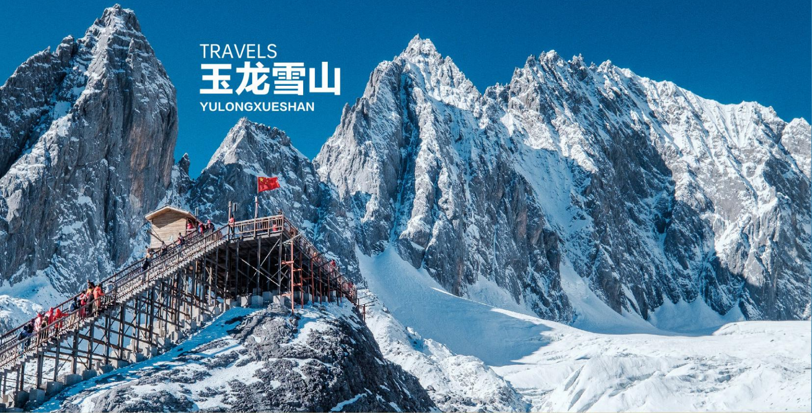
TRAVELS 玉龙雪山 YULONGXUESHAN

Yunnan's most comfortable strongest experience best reputation, pure fun tourism