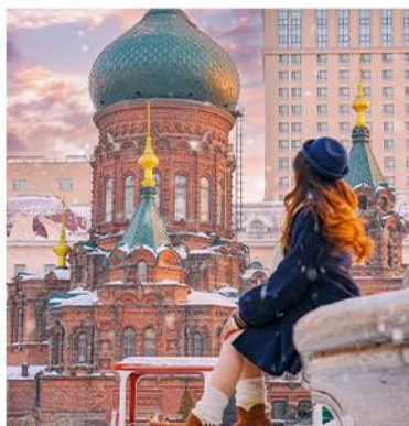
—圣·索菲亚教堂— 网红写真出片地