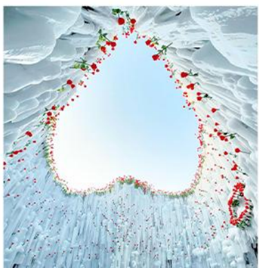
—冰封玫瑰— 冰雪世界中的浪漫奇观