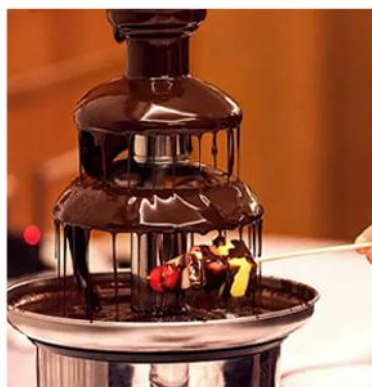
—巧克力瀑布— 巧克力的诞生奇迹