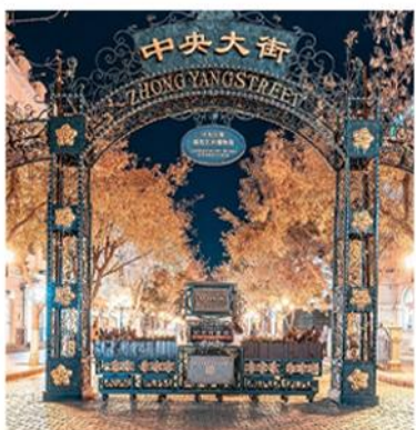
—中央大街— 百年积淀的文化底蕴