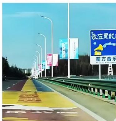
—音乐公路— 炫酷解锁网红打卡新地标