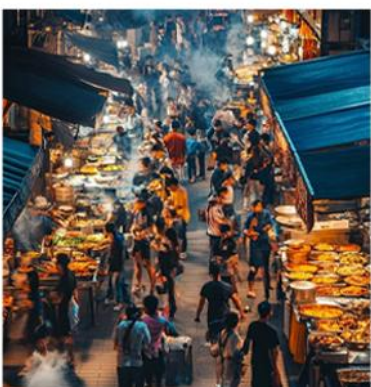
—云顶市集— 真实的人间烟火气