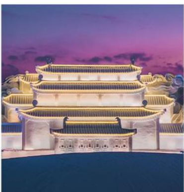
—云顶天宫雪雕— 冬日仙境震撼开启