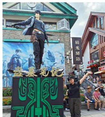
—稻米驿站— 十年之约