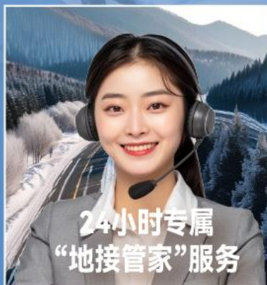
24小时专属 “地接管家”服务