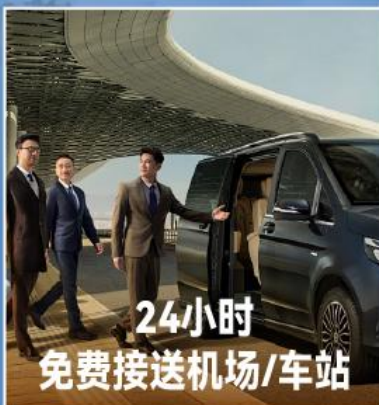
24小时 免费接送机场/车站