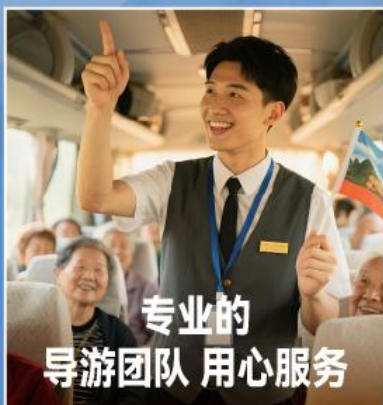
专业的 导游团队 用心服务