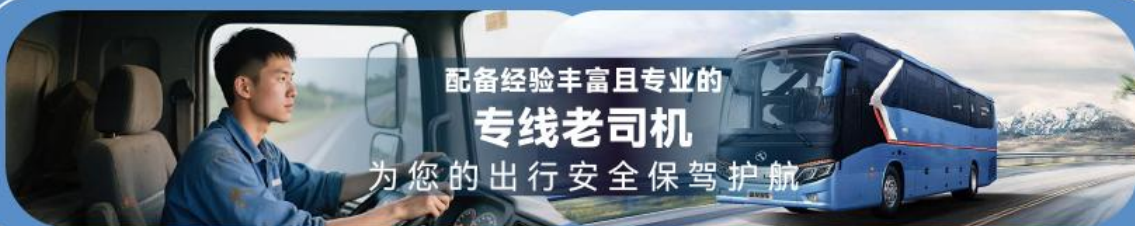
配备经验丰富且专业的 专线老司机 为您的出行安全保驾护航