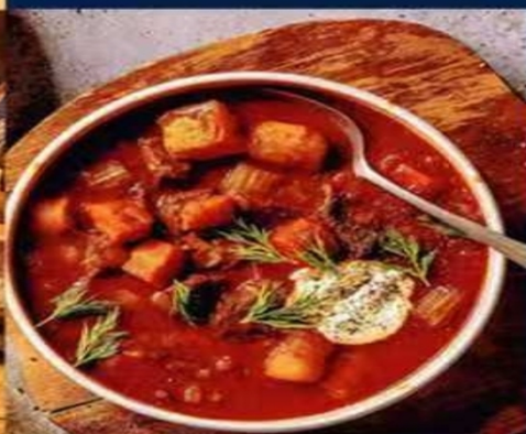
匈牙利牛肉汤套餐