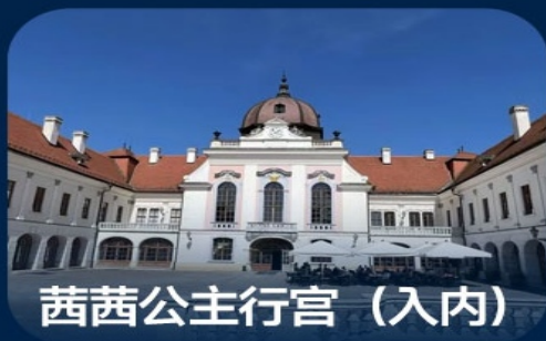
茜茜公主行宫（入内）