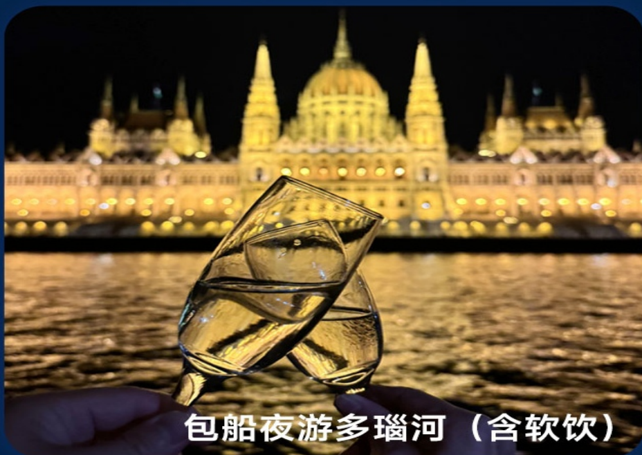
包船夜游多瑙河（含软饮）