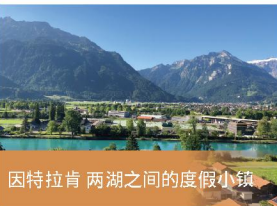
因特拉肯 两湖之间的度假小镇