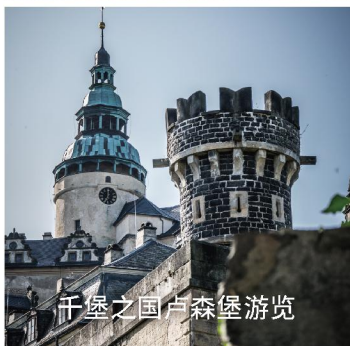
千堡之国卢森堡游览