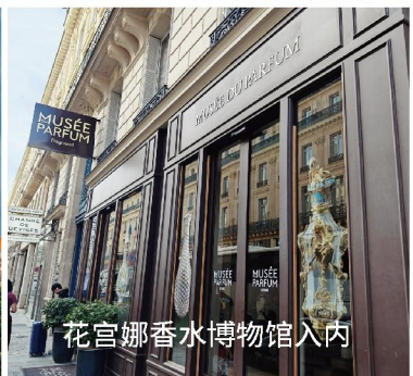
花宫娜香水博物馆入内