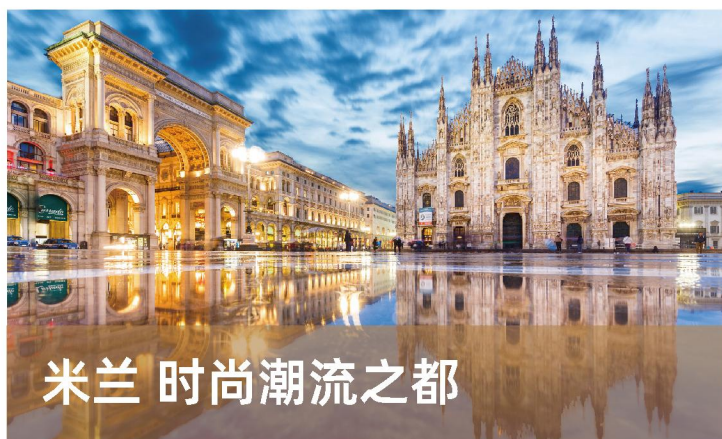
米兰 时尚潮流之都