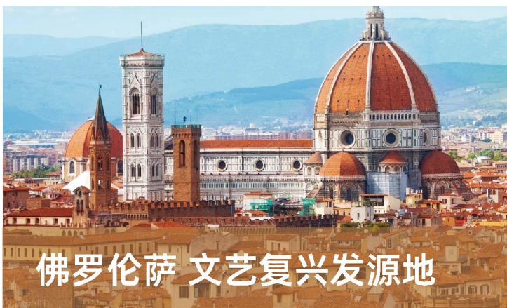
佛罗伦萨 文艺复兴发源地