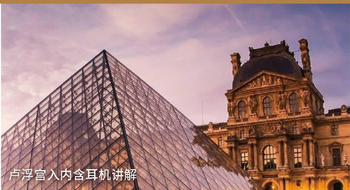
卢浮宫入内含耳机讲解