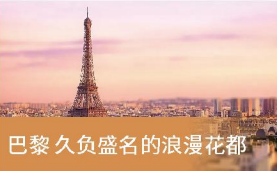
巴黎 久负盛名的浪漫花都