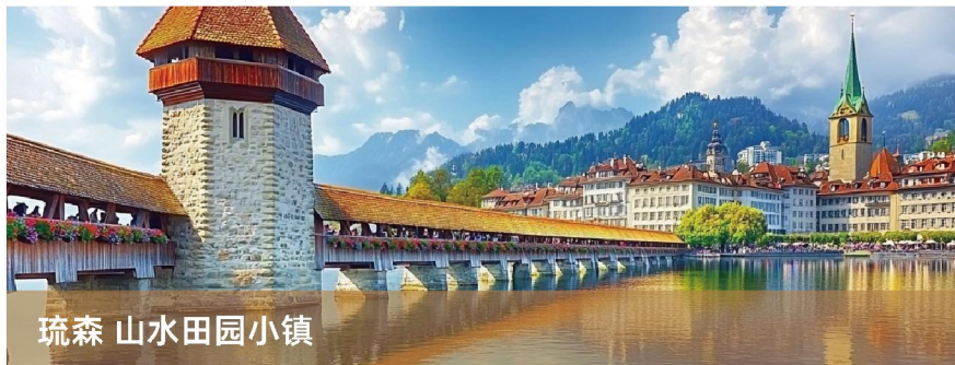
琉森 山水田园小镇