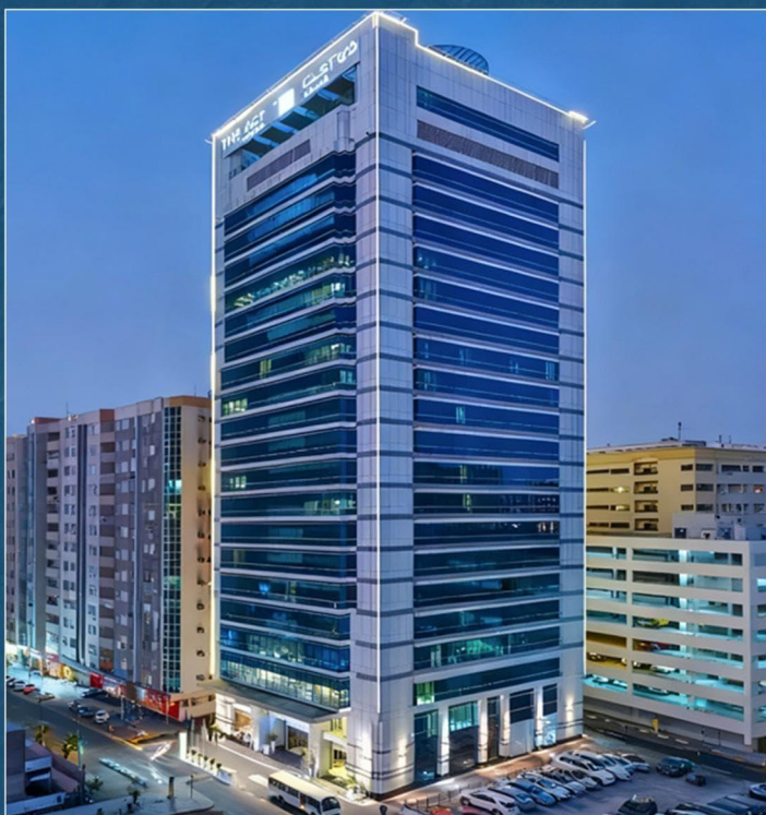
{ 沙迦阿克特酒店或沙迦海滨72号酒店 } The Act Hotel Sharjah或Hotel 72 Sharjah Waterfront