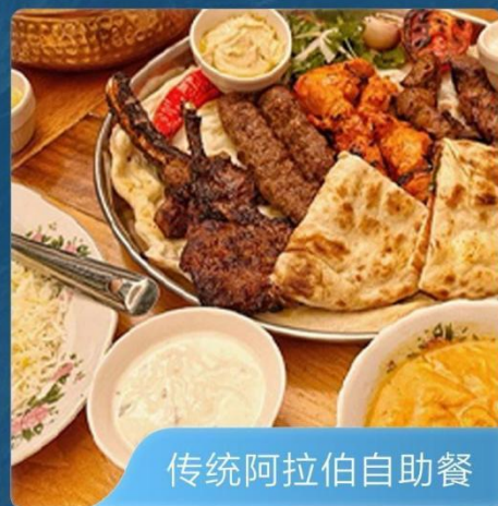
传统阿拉伯自助餐