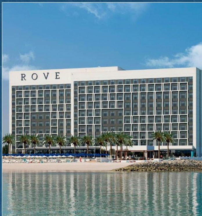
{ 拉斯海马海边度假酒店 } Rove Al Marjan Island, Ras Al Khaimah