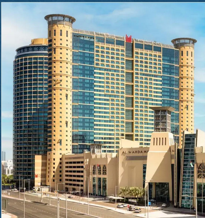
{ 阿布扎比阿尔瓦赫达千禧大酒店或罗塔纳公园酒店 } Grand Millennium Al Wahda Hotel或Park Rotana