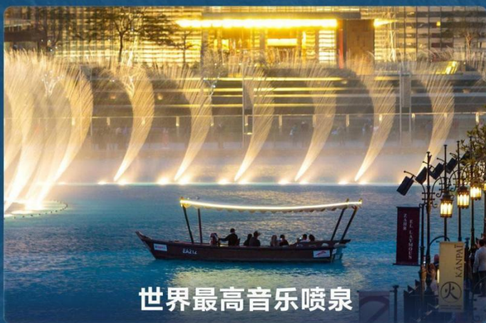
世界最高音乐喷泉