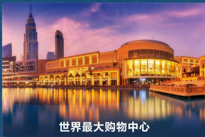
世界最大购物中心