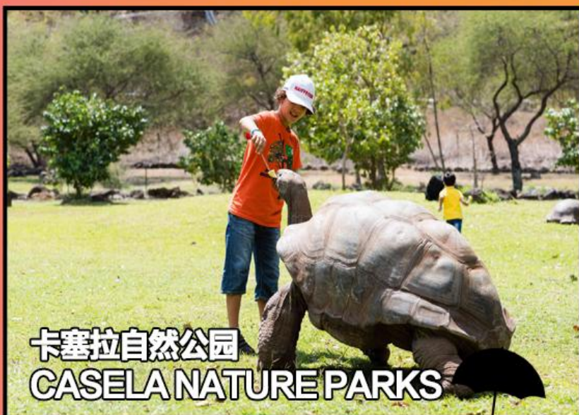
卡塞拉自然公园 CASELA NATURE PARKS