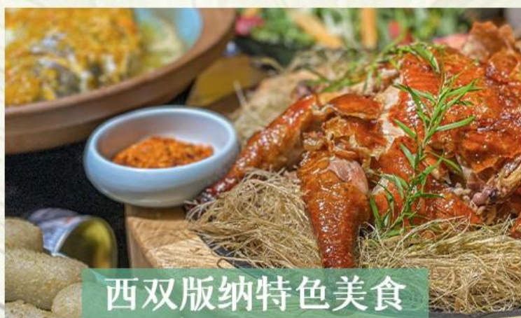
西双版纳特色美食