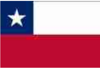
【智利旅行注意事项】