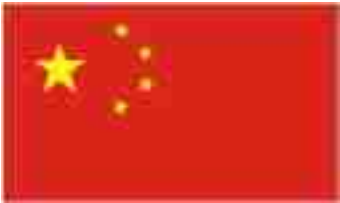
【中国海关出境须知】