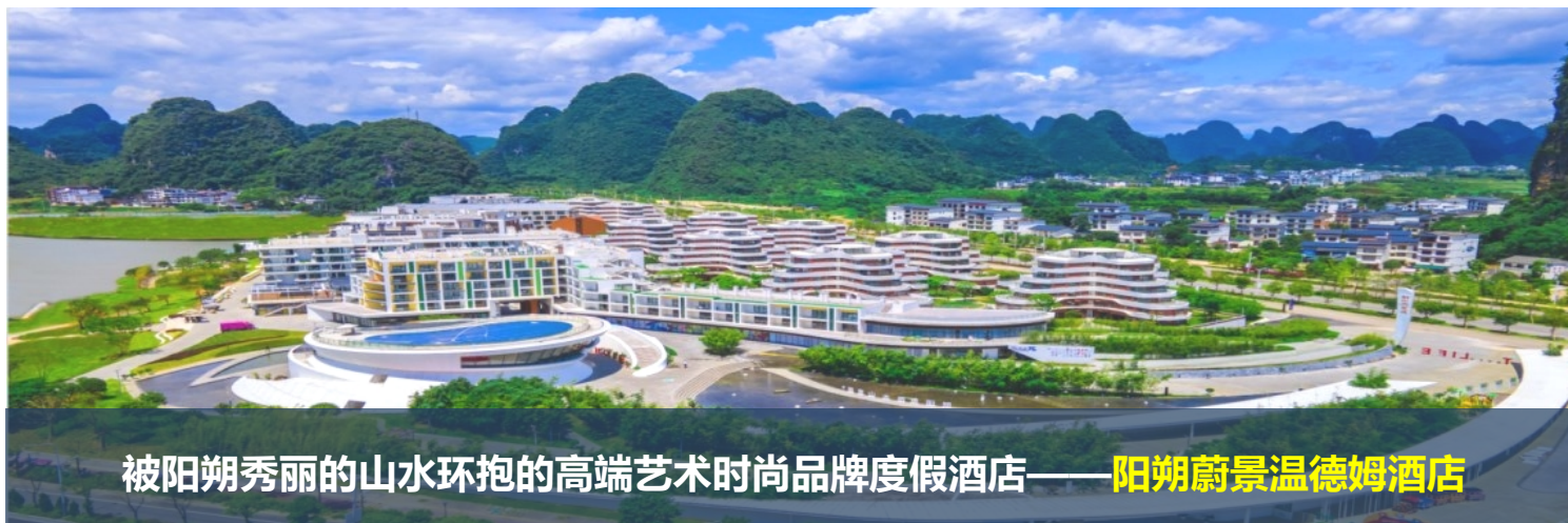
被阳朔秀丽的山水环抱的高端艺术时尚品牌度假酒店—— 阳朔蔚景温德姆酒店