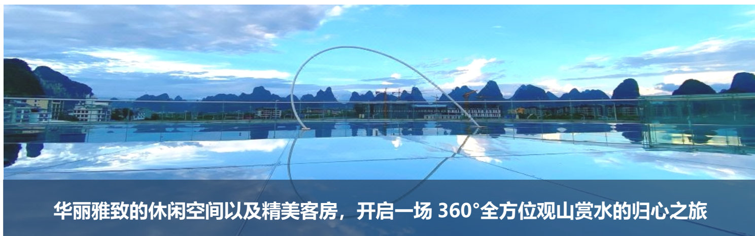
华丽雅致的休闲空间以及精美客房，开启一场 360°全方位观山赏水的归心之旅