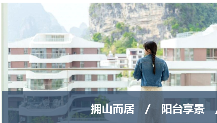
拥山而居 / 阳台享景 / 开窗如画 / 溪下泛舟