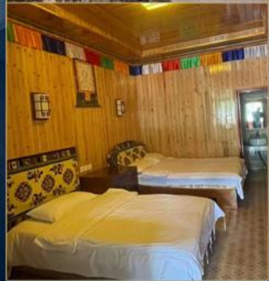
川主寺祥瑞大酒店