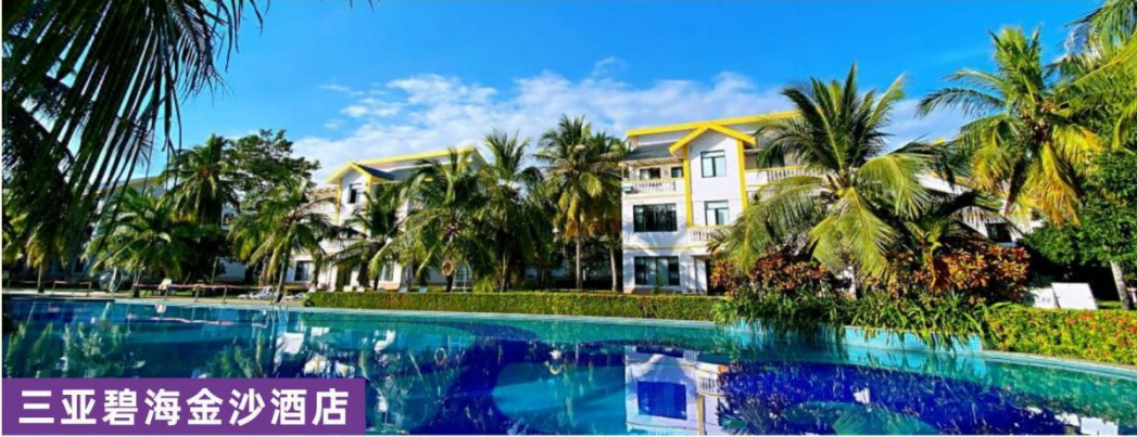
三亚碧海金沙酒店