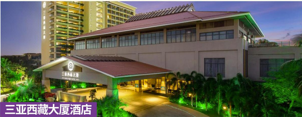
三亚西藏大厦酒店