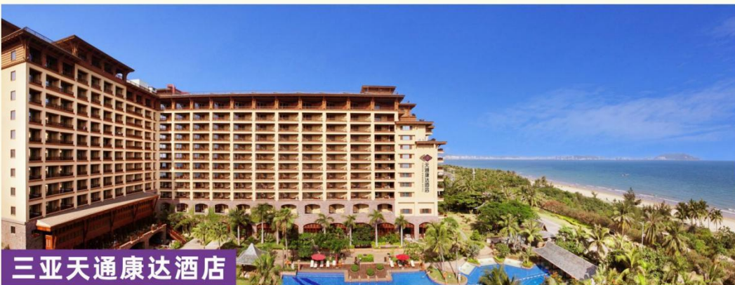
三亚天通康达酒店