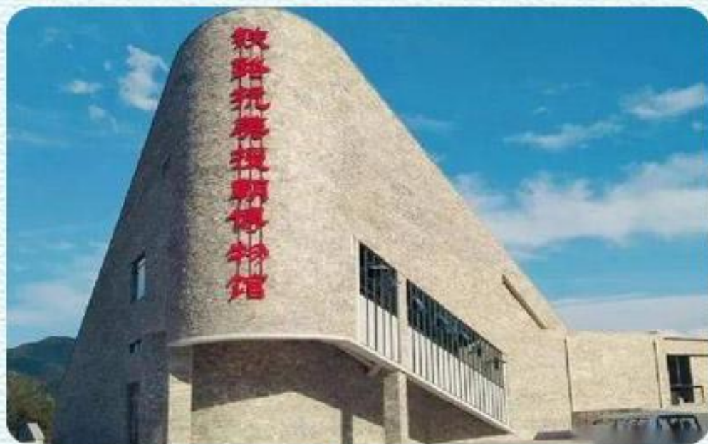
▲ 铁路抗美援朝博物馆