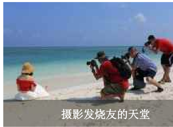
摄影发烧友的天堂